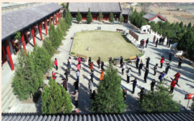
清晨早操 井然有序