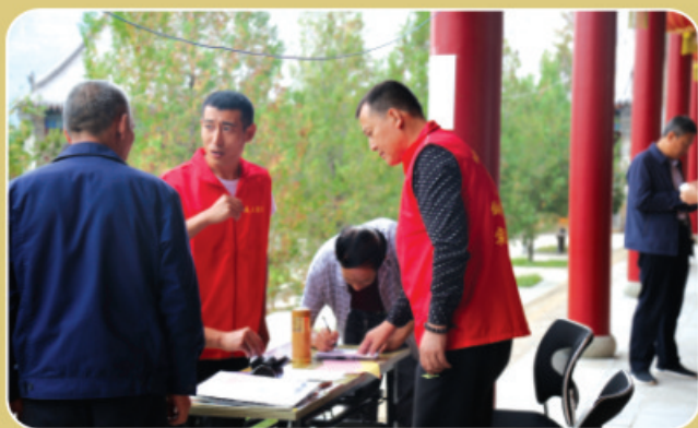
远道而来，报名登记