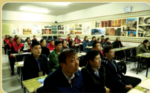
全神贯注，聆听入心