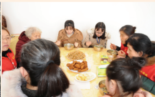
谁知盘中餐 粒粒皆辛苦