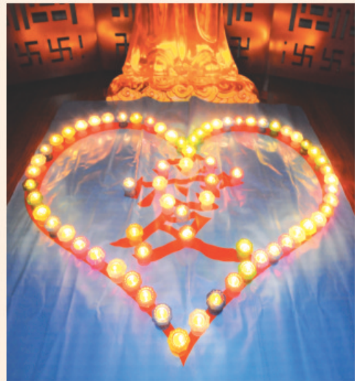
心灯传递 大爱无疆