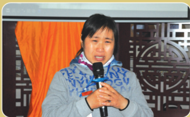
痛哭悔恨，孝心感动