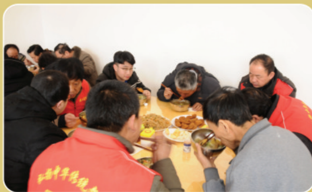
饮食素餐，心怀善念