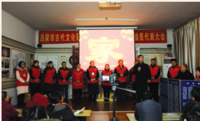
爱心义工 交流心得