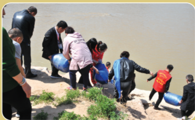
黄河放生，万物皆灵