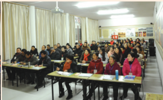
怀着一颗敬仰的心认真听课