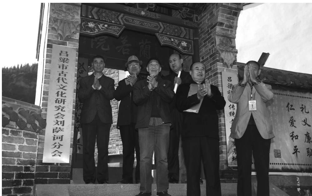
吕梁市古代文化研究会刘萨河分会揭牌仪式

我在这里代表吕梁祥和传统文化教育中心先给大家拜一个早年（鞠躬），祝愿各位老师及家人在狗年（狗是忠臣）学业有成、事业有成，祝愿各位老师及其家人身体健康！家庭和睦！幸福快乐！吉祥如意！