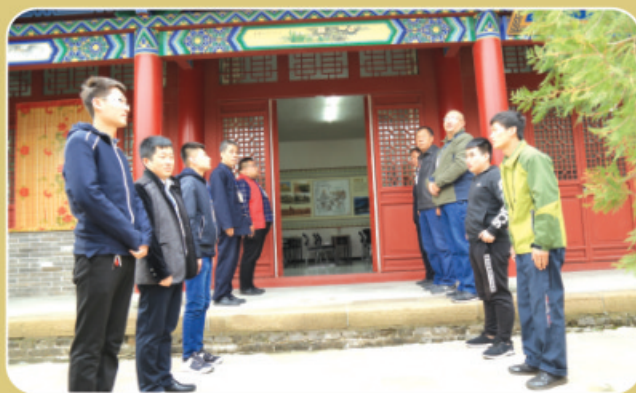
列队恭候，欢迎入场