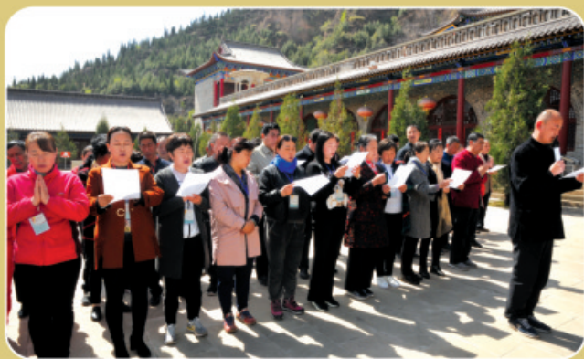
积善之家，必有余庆