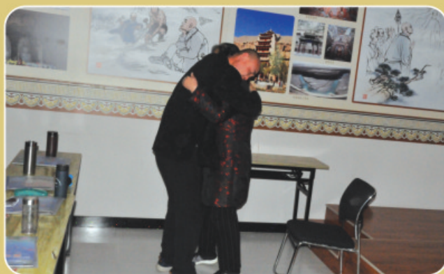
深受教诲，感恩父母