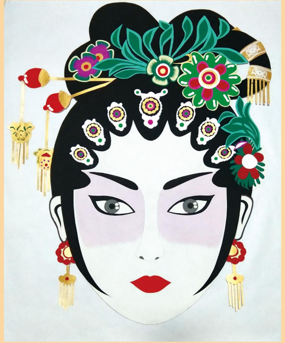
晋剧脸谱 (彩色剪纸)