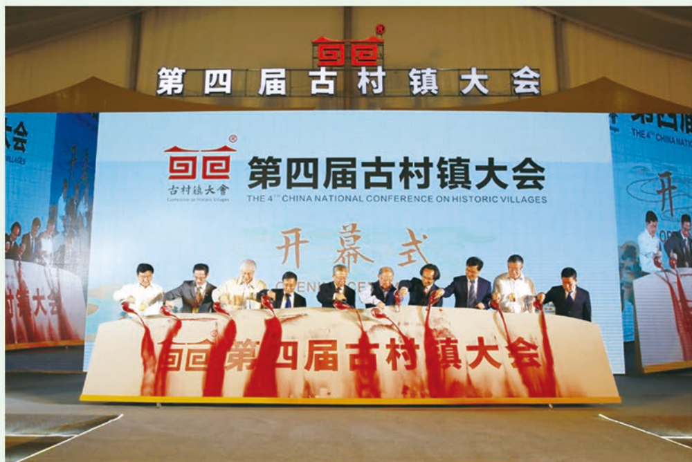
中共吕梁市委书记李正印、吕梁市人民政府市长王立伟等领导参加大会启动仪式