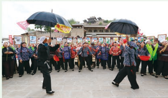
广场伞头秧歌表演