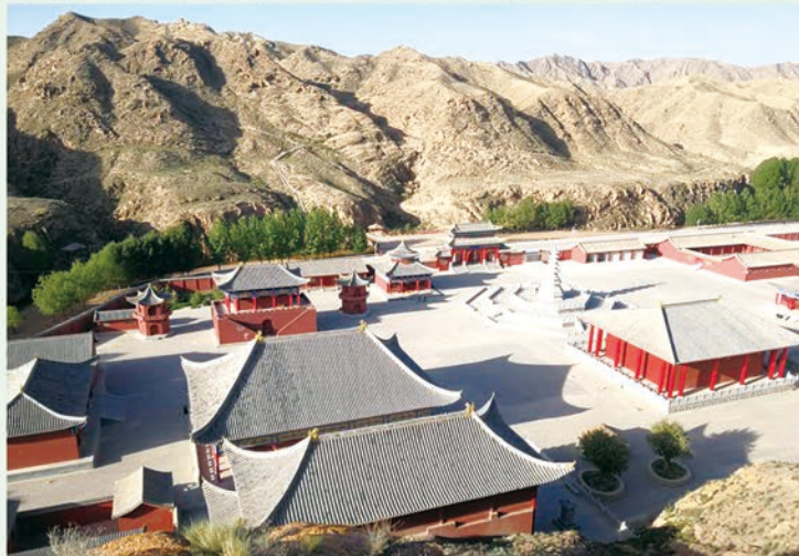
甘肃永昌圣容寺，离石籍古代高僧刘萨诃预言瑞像的圣地，摄于2019年5月。